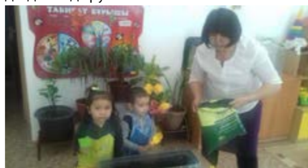
Сурет 1. «Гүл егу» Топырақты әзірлеу Дәнді егу, су құю Мақсаты: Гүлдің дәнін егу жолын көрсету, су құю тәртібін үйрету, табиғатты аялауға тәрбиелеу

Мақсаты: Гүл туралы түсініктерін молайту; «Гүл – жердің көркі» тақырыбын ашу мақсатында балалардың қатынасуымен қойылым ұйымдастыру, балалардың ынтасын жоғарылату, топтық жұмысқа дағдыландыру.