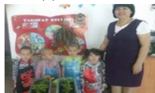
Сурет 4 «Аулаға егу»

«Гүлдің өскіні» Күнделікті гүлдің өскінін бақылау. Релаксация Мақсаты: еңбексүйгіштікке, ұқыптылыққа, тазалыққа баулу.