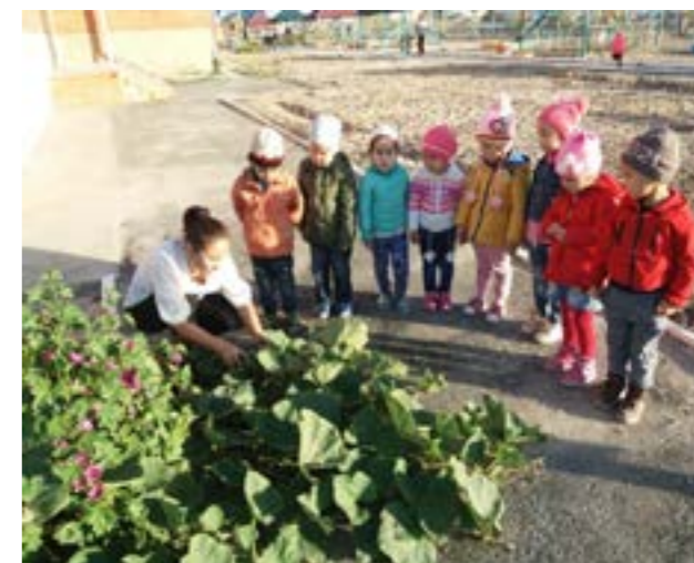
Су қауақты зерттеу жұмысының барысы