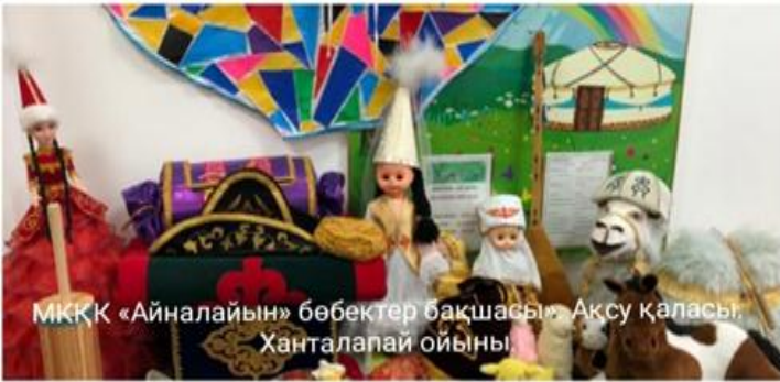
МҚКК «Айналайын» бөбектер бақшасы, Ақсу қаласы. Ханталапай ойыны.